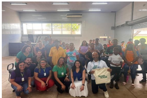
Oficina para famílias em alusão ao Dia Nacional da Consciência Negra