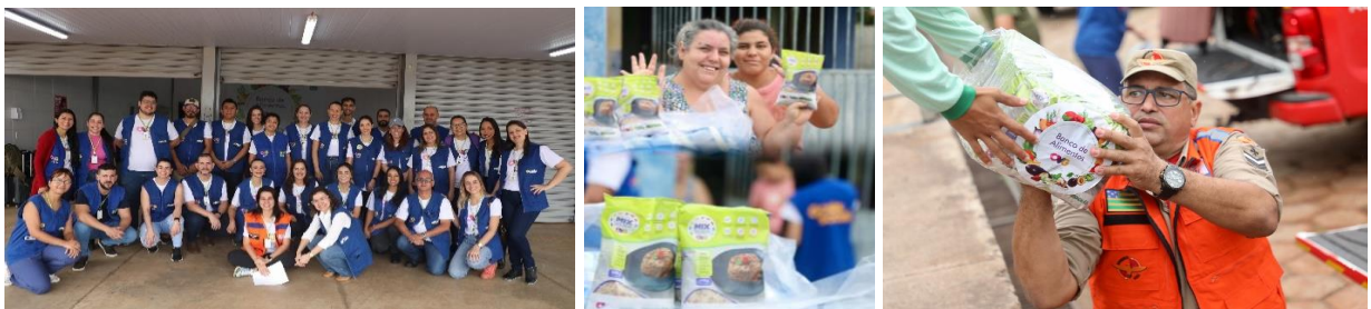
Participação na Operação Goiás Alerta e Solidário