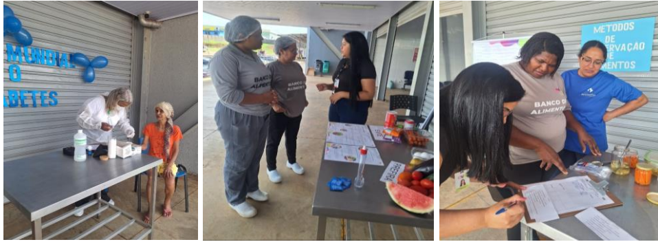
Capacitação em alusão ao Dia Mundial do Diabetes e Técnicas de Conservação dos Alimentos