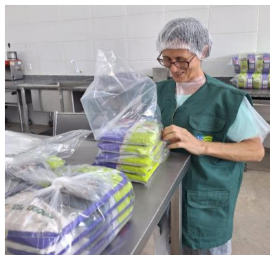
Voluntária auxiliando nas atividades de empacotamento