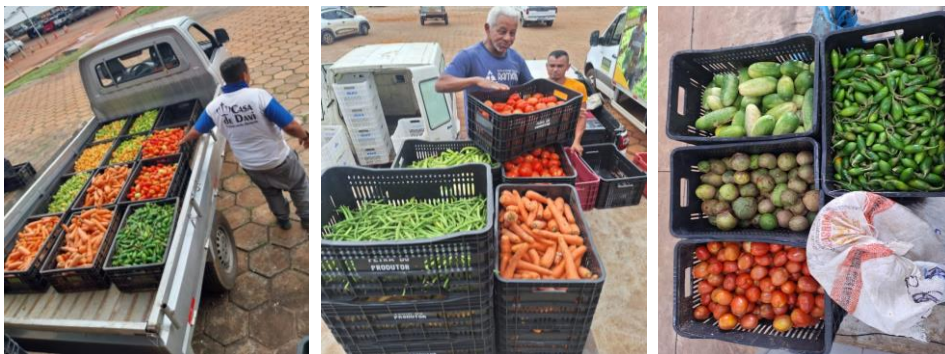
Distribuição para as Entidades Sociais