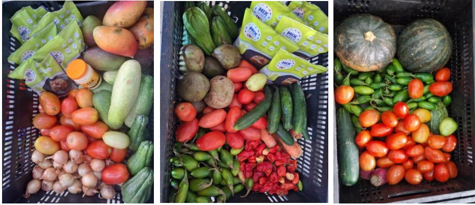
Distribuição para as Famílias