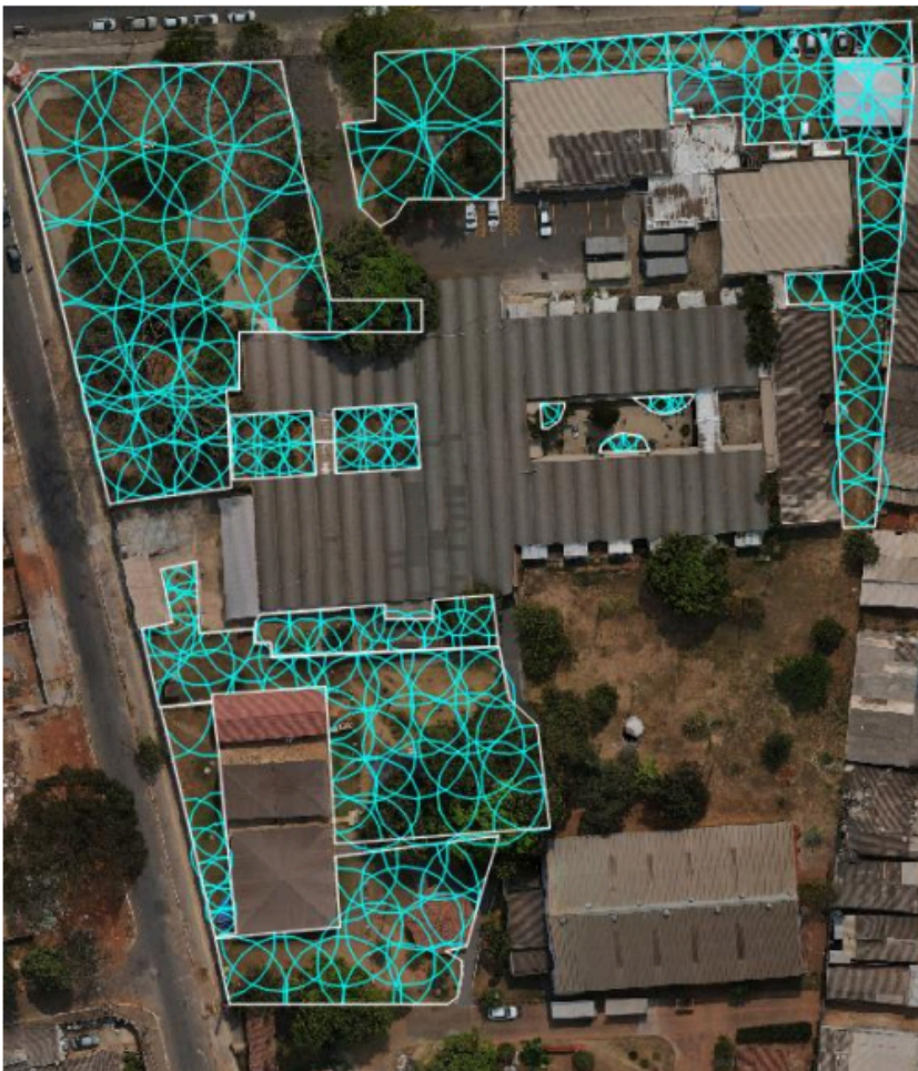
Figura 02 - Setores a serem irrigados circulos em azul.