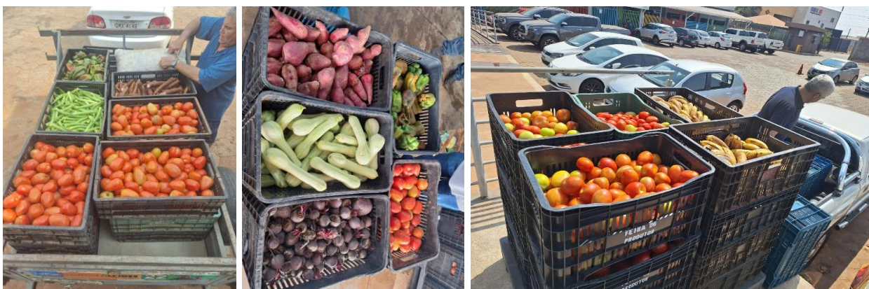
Distribuição para as Entidades Sociais