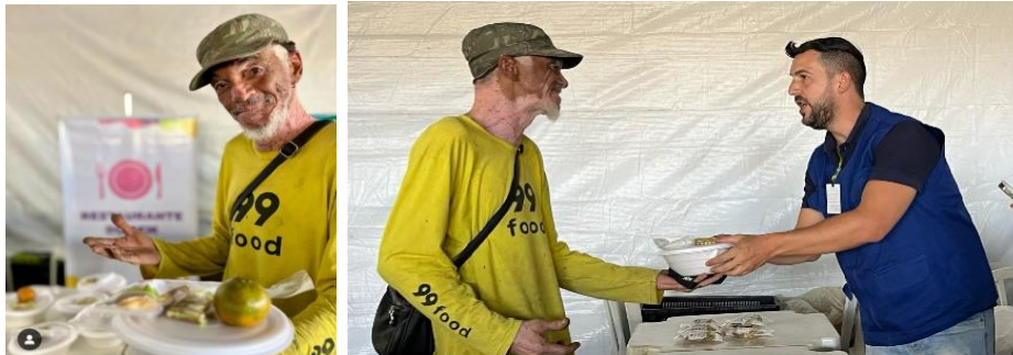
Participação na 8ª edição do Programa Dignidade na Rua