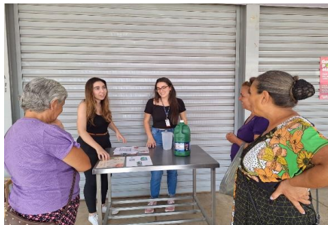
Capacitação para famílias e entidades sobre "Higienização adequada de hortifrúteis"