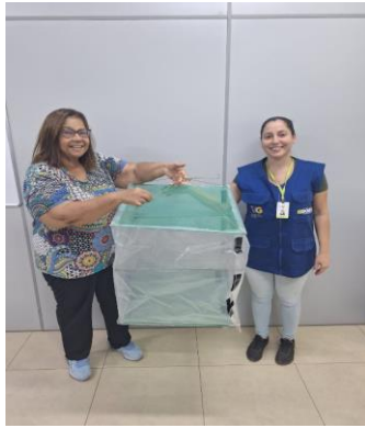
Entrega de Secador Solar para usuários da unidade