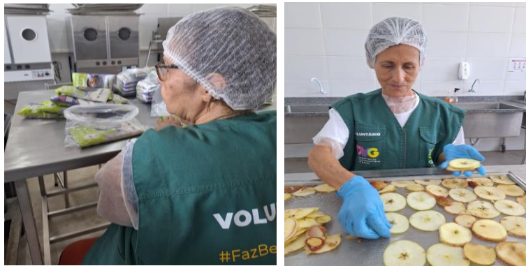
Voluntários auxiliando nas atividades de empacotamento e produção