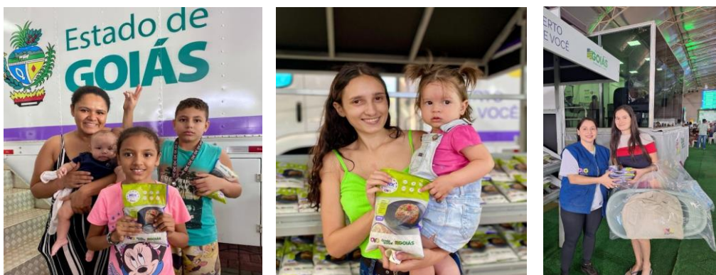
Ação OVG Perto de Você nos municípios de Senador Canedo e Aparecida de Goiânia