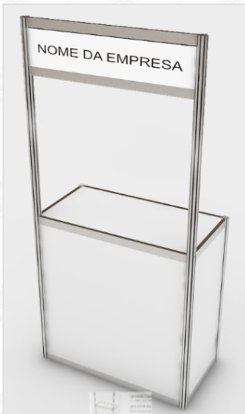
Balcão com testeira.