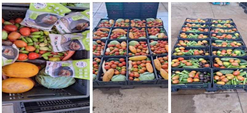
Distribuição para as Famílias