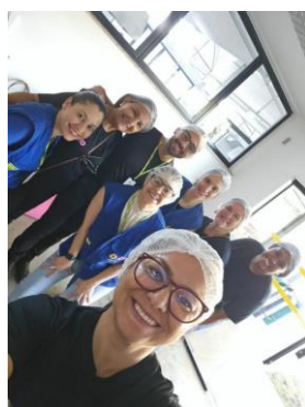
Participação na seleção dos cessionários para a Vila Gastronômica do Natal do Bem 2024