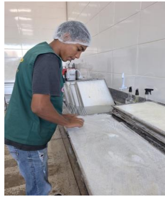
Voluntários que auxiliaram nas atividades de empacotamento e higienização