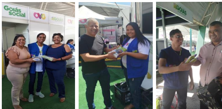
OVG Perto de Você nos municípios de Santa Cruz de Goiás e Goiânia