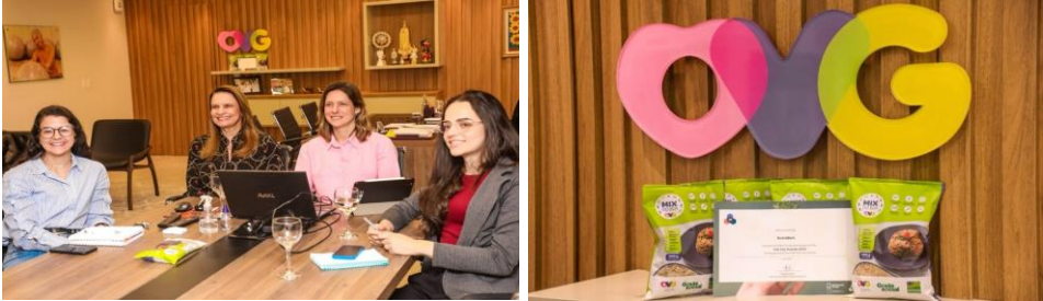
Apresentação do “mix do bem” para os demais vencedores do prêmio internacional Fab City Awards 2024