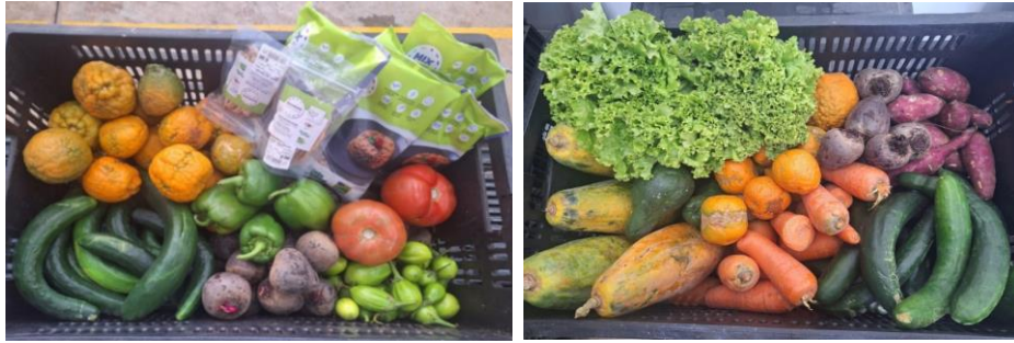
Distribuição para as Famílias