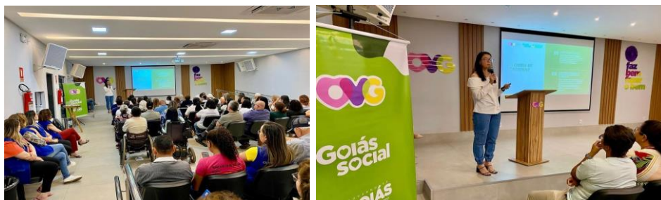
Capacitação em parceria com a SEAPA, sobre o Programa de Aquisição de Alimentos (PAA) para as entidades cadastradas no Banco de Alimentos