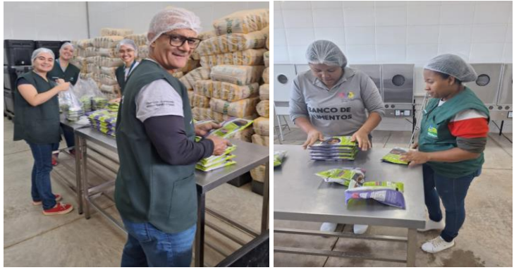
Voluntários do mês de Julho