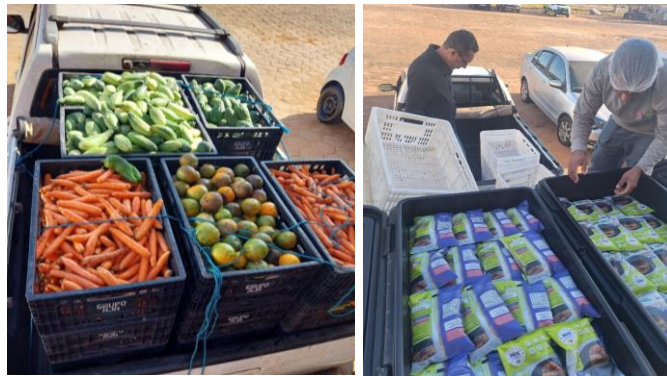
Distribuição para as Entidades Sociais