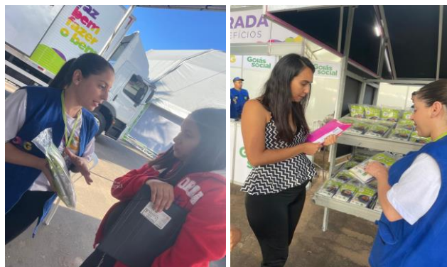
Ação OVG Perto de Você no município de Jaraguá