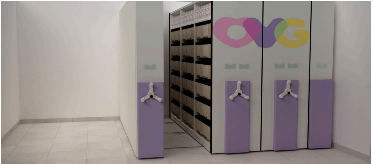
PERSPECTIVA DE INSTALAÇÃO

GERÊNCIA DE ADMINISTRAÇÃO DE PESSOAL DA ORGANIZAÇÃO DAS VOLUNTÁRIAS DE GOIÁS - OVG, AOS 29 DIAS DO MÊS DE MAIO DE 2024.