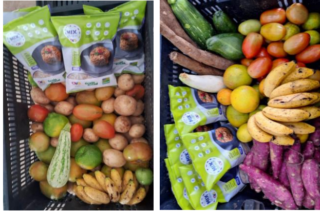
Distribuição para as Famílias