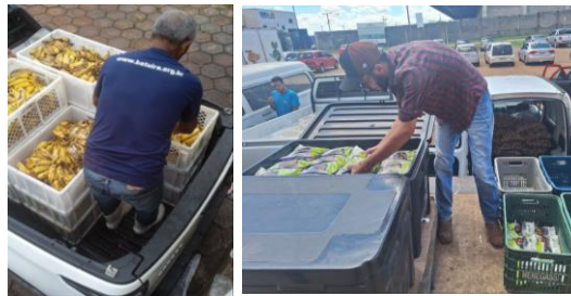
Distribuição para as Entidades Sociais