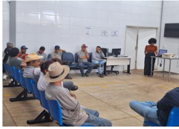
Capacitação Colaboradores: Saúde Mental no Trabalho