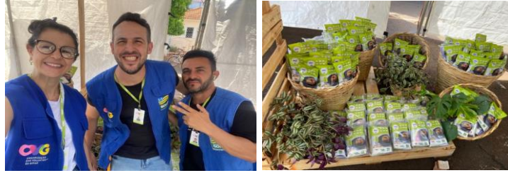
Inauguração do Restaurante do Bem em Quirinópolis