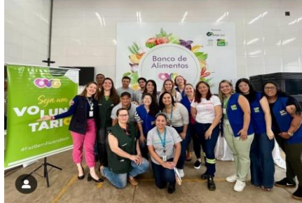
Capacitação para Formação de Voluntários