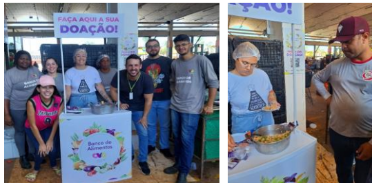
Ação CEASA na Pedra 80: Mobilização de Doadores