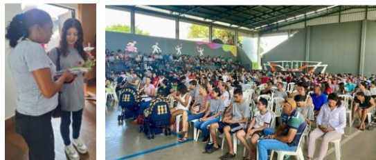
Reunião da Família no Centro da Juventude Tecendo o Futuro