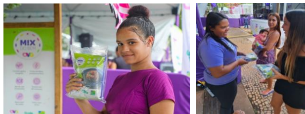
1ª Edição do Goiás Social Mulher