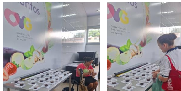
Capacitação Famílias e Entidades: Ação Páscoa e Aproveitamento dos Alimentos