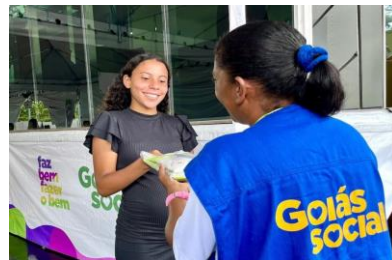
OVG perto de Você em Mineiros