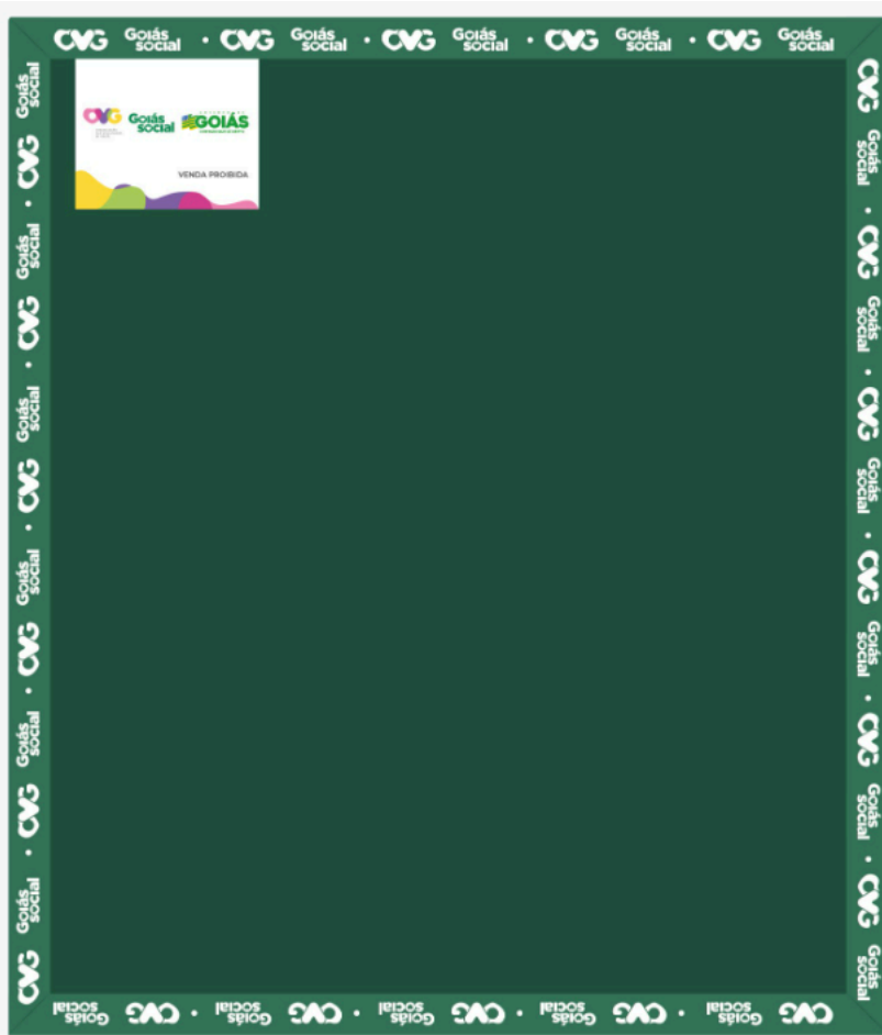
Verso do cobertor,